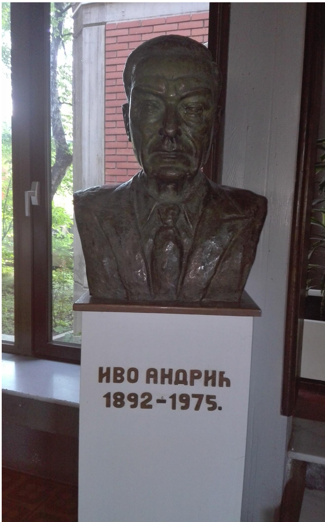
Прилог 2- Слика за слагалицу која води до блага